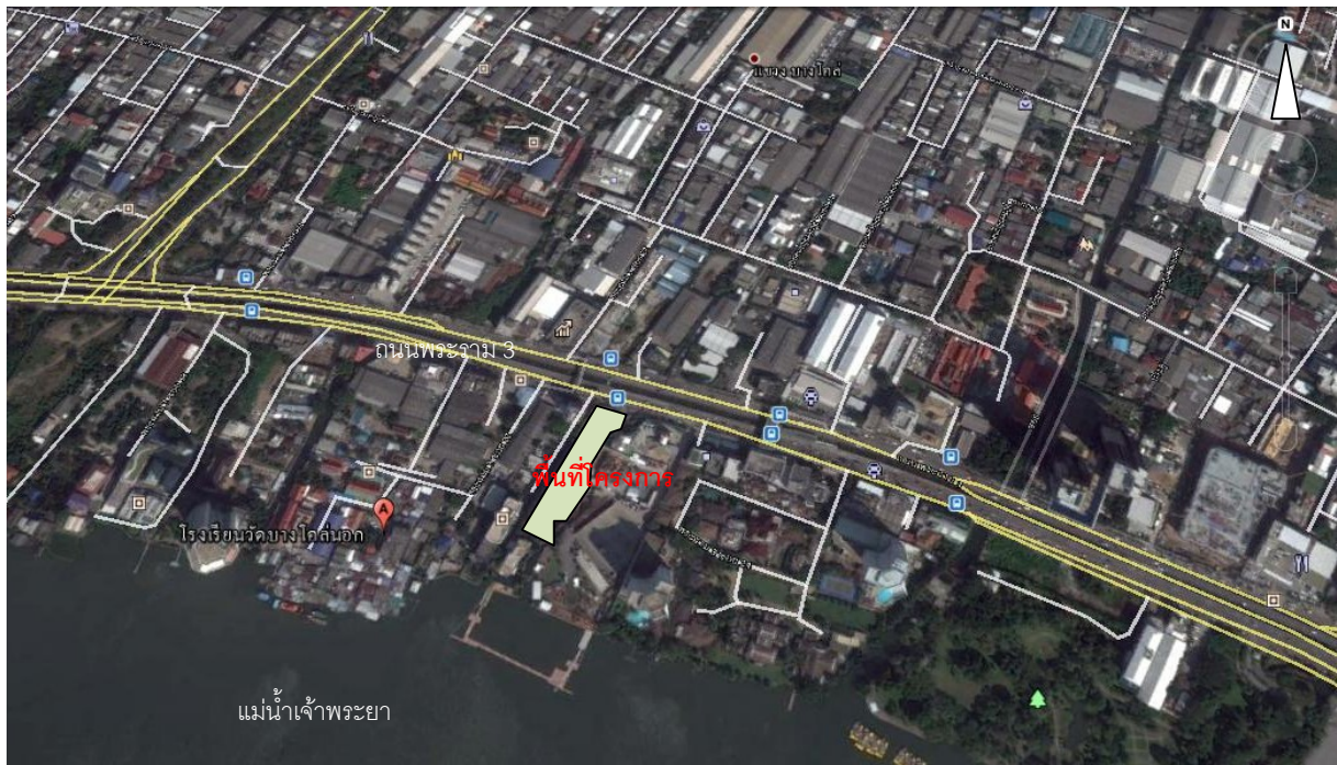
ภาพที่ 1 จุดที่ตั้งพื้นที่โครงการ